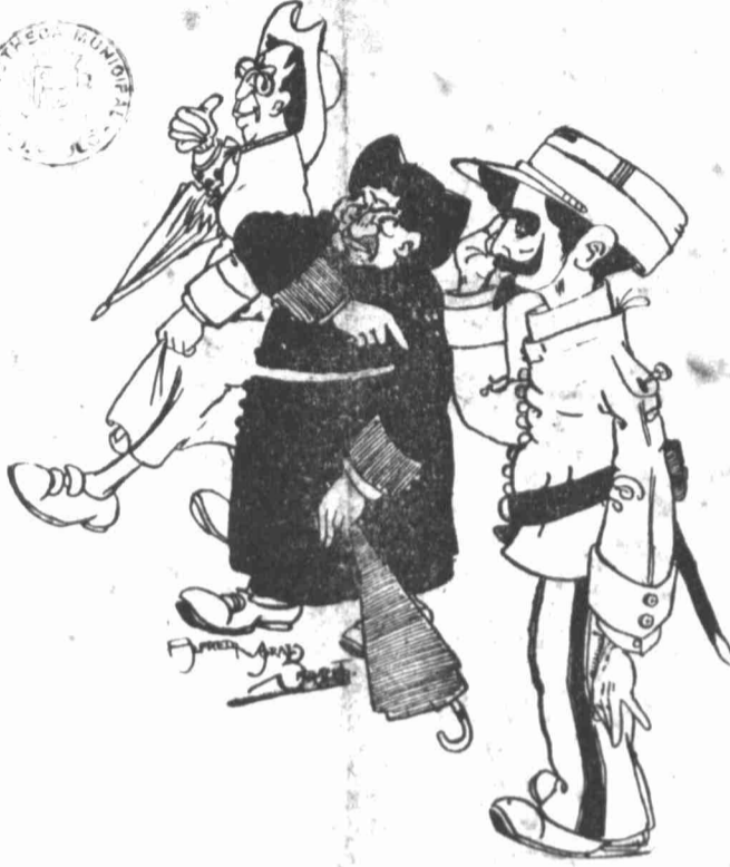
— Agora, que te mostraste tão dedicado espaldeirando os herejes, vai velar ali á porta, enquanto nós vamos dormir.

Entretanto a campanha continuava despertando sempre maior interesse, enchendo de indignação todas as almas puras a evidente protecção dispensada aos accusados.